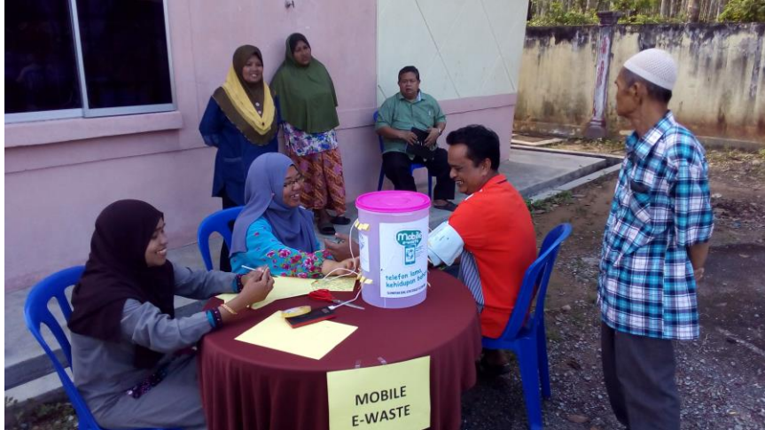
Pemeriksaan tekanan darah, Dashboard My Health.