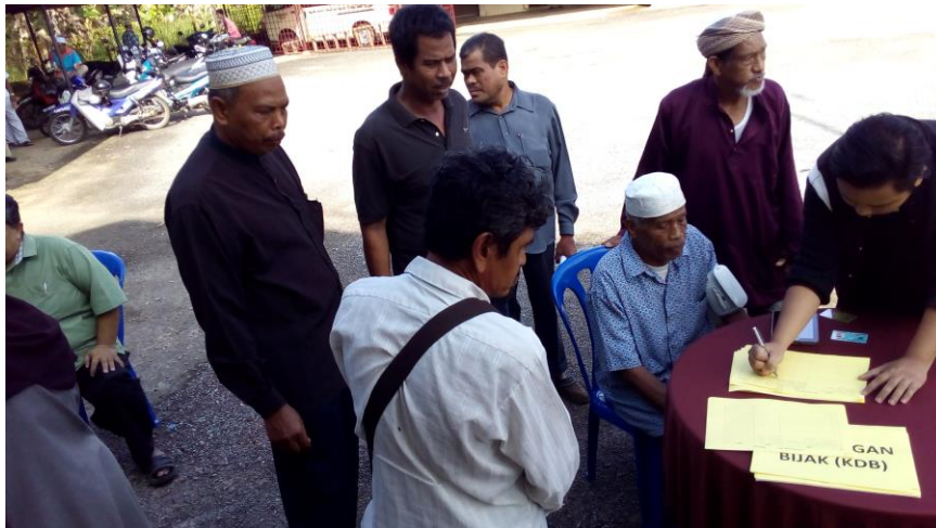
Dashboard My Health mendapat sambutan menggalakkan dari warga emas dan dewasa.