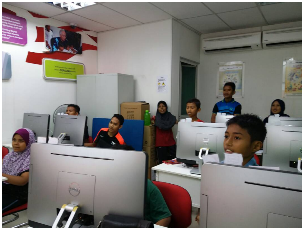
Antara peserta yang menyertai bengkel Kahoot IT.